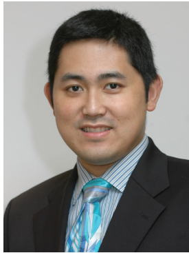
YAM Pengiran Muda Abdul Qawi